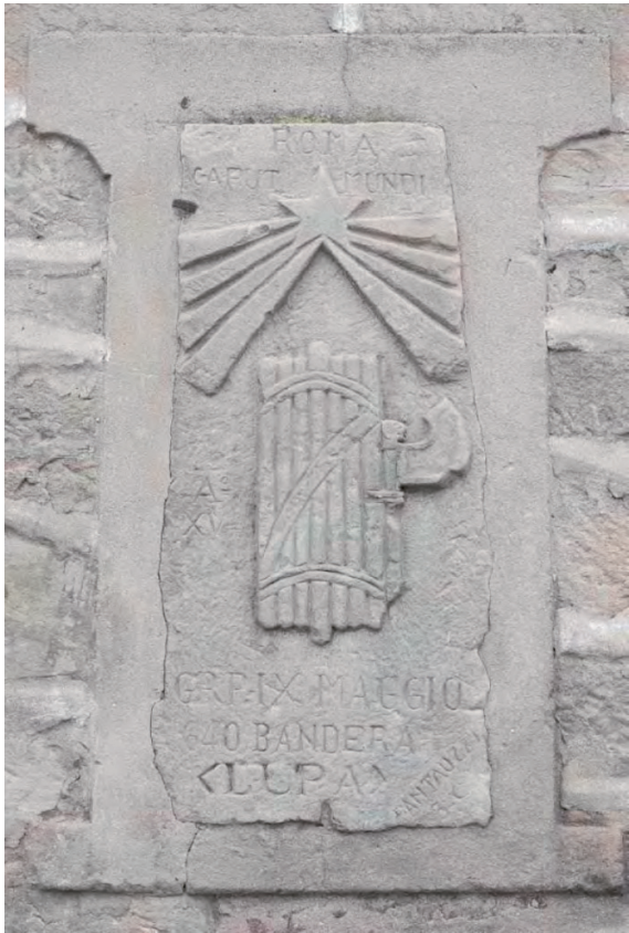
Placa de piedra del Corpo Truppe Volontaire en Fontecha (Lantarón).