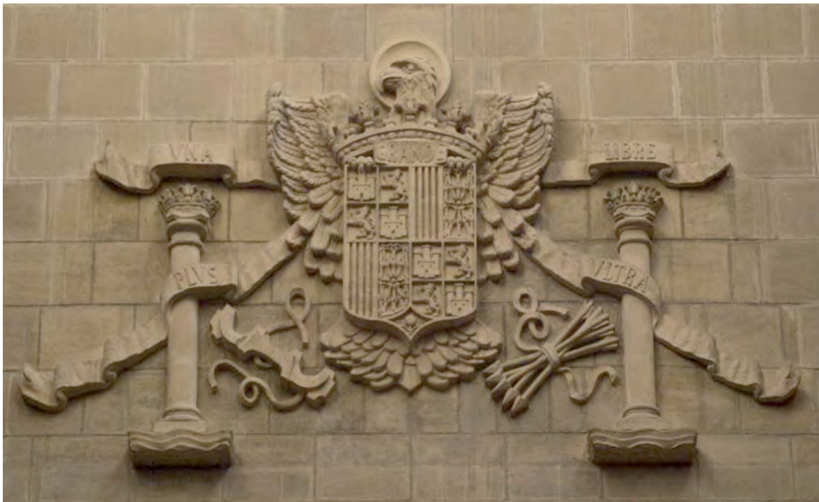
Escudo oficial en la catedral nueva (Vitoria-Gasteiz).