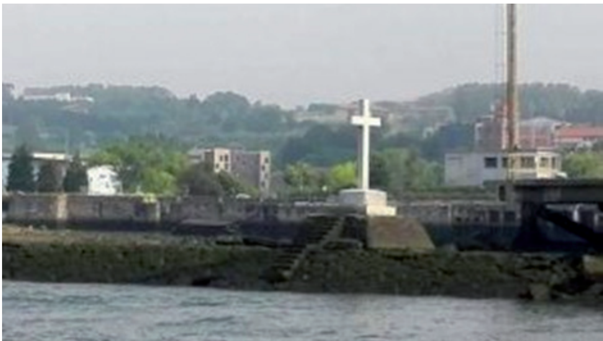
Cruz en memoria de las víctimas del asalto al Altunamendi, en la dársena de Axpe (Erandio).