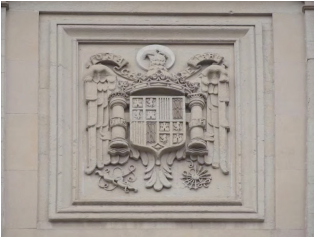
Escudo oficial en el antiguo Palacio de Justicia de la calle Olaguíbel (Vitoria-Gasteiz)