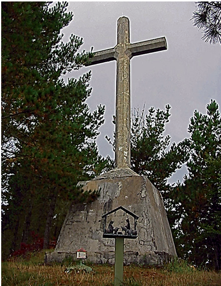
Cruz del monte Morkaiko (Elgoibar).