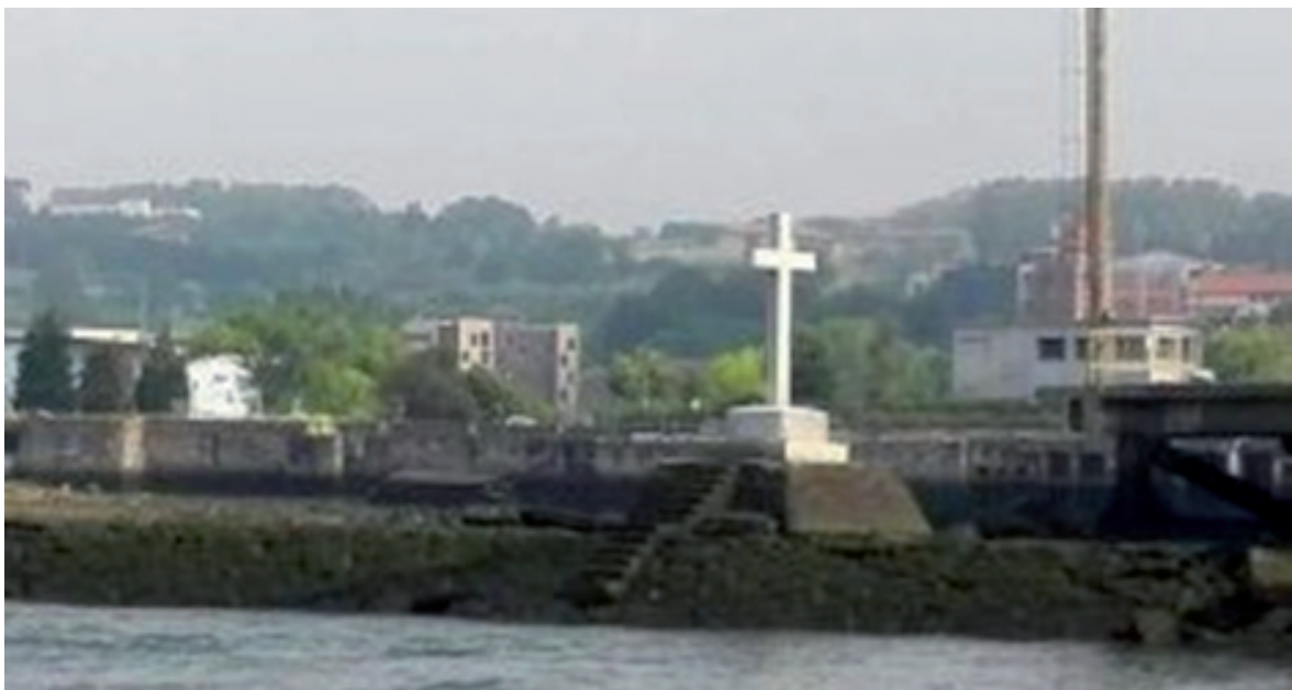
Altunamendi itsasontziari egindako erasoan hildako biktimak oroitzen dituen gurutzea, Axpeko dartsenan (Erandio).