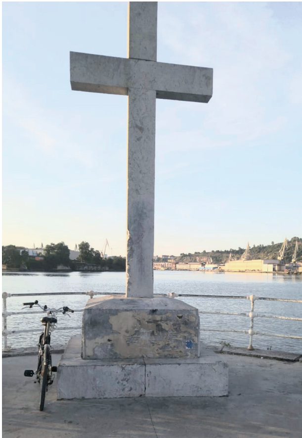
Cabo Quilates itsasontziari egindako erasoan hildako biktimak oroitzen dituen gurutzea (Barakaldo).