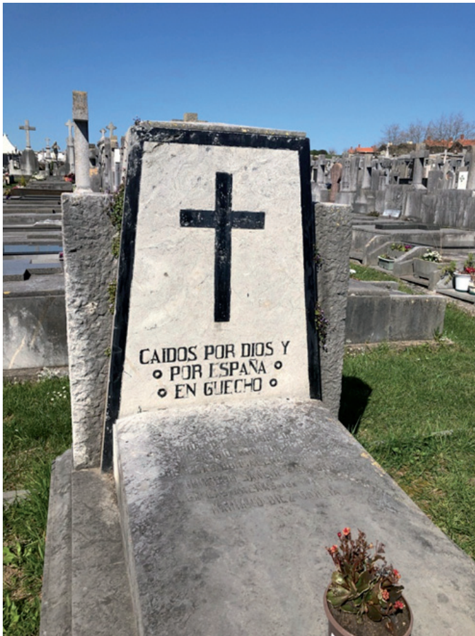
Hillarria, "Getxon eroriak Jainkoaren eta Espainiaren alde" (Getxo).