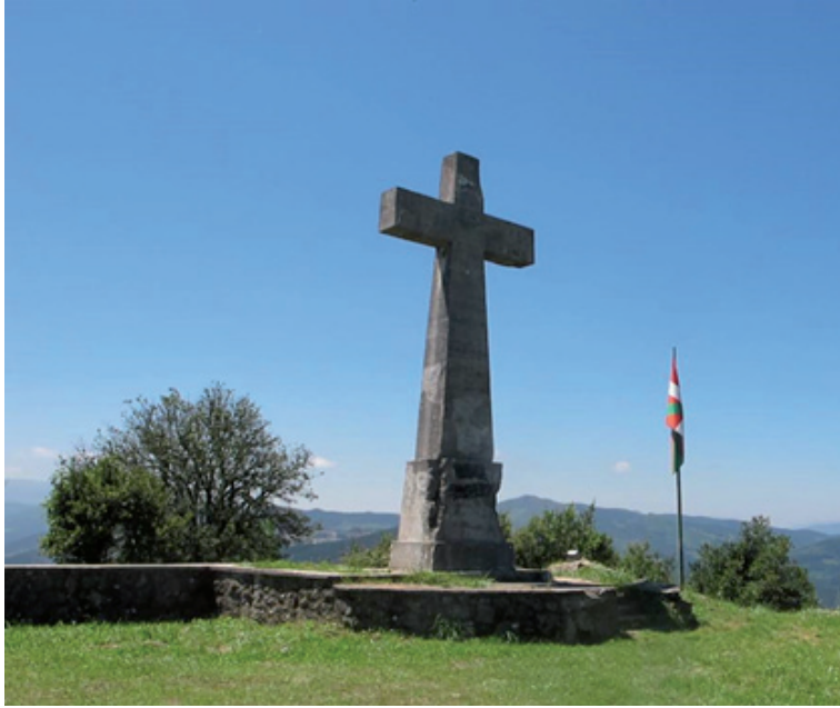
Gurutze-bidea eta erorien omenezko gurutzea Lemoatxen (Lemoa).